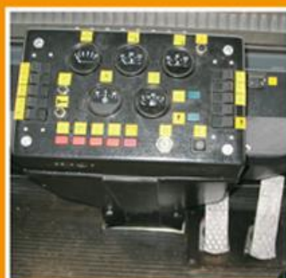
Панель приборов The instrument panel