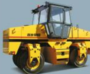
Вибрационный для грунта Vibratory road rollers for soil