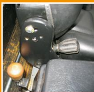
Регулируемое сидение оператора Adjustable operator's seat