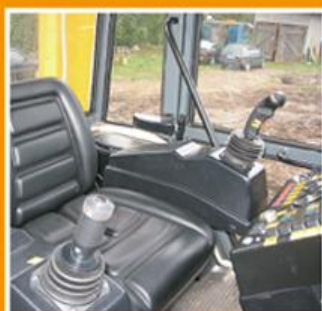
Просторная кабина Spacious cabin