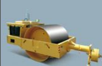
Вибрационные комбинированные Combined vibratory road roller